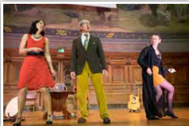
Révolutions Vocales Compagnie VocAliques.