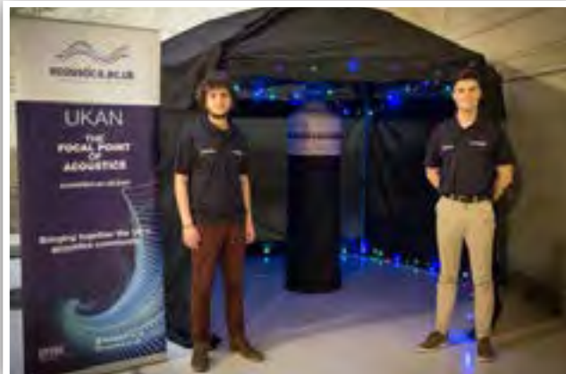
Una de las dos instalaciones, con estudiantes de la Universidad de Southampton autores de su desarrollo.