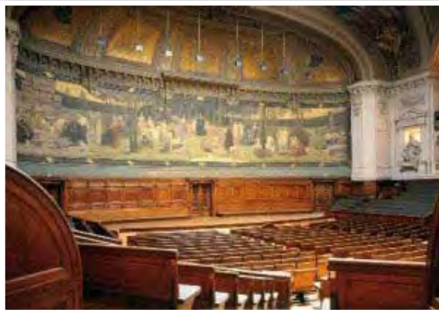
Gran Anfiteatro de la Universidad de la Sorbona.