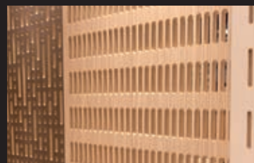
Sistema PAR Paneles acústicos ranurados