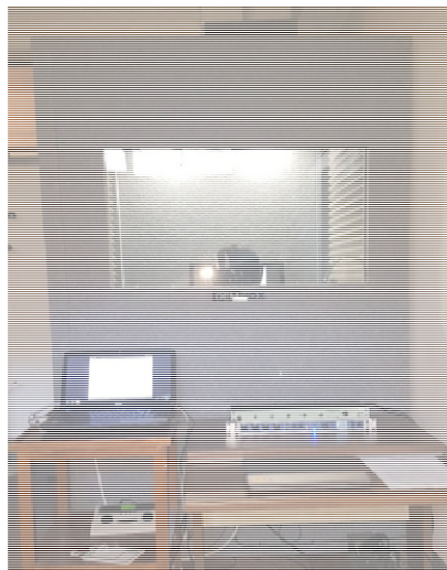
Figura 3: Persona dentro de la cabina DEMVOX ECO100 realizando el listening test

una pantalla, un ratón, un pulsador y unos auriculares. El resto de los equipos se instalaron fuera de la cámara para evitar ruidos procedentes de los métodos de disipación de portátiles y amplificadores.