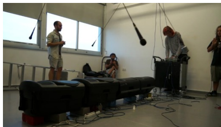
Fig.5 Interpretación de Pendulum Music de Steve Reich (1968-1973)