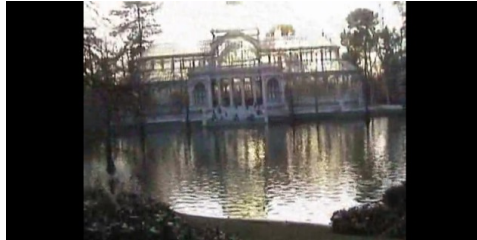
Fig.6 Fotograma de Obertura para un paisaje urbano (2002) de Enrique Igoa

Enrique Igoa, Profesor y Compositor, del Real Conservatorio Superior de Música de Madrid, aportó una obra multimedia suya para nuestro conocimiento, que reflexiona ampliamente sobre la naturaleza de los sonidos urbanos en Madrid: Obertura para un paisaje urbano (2002):