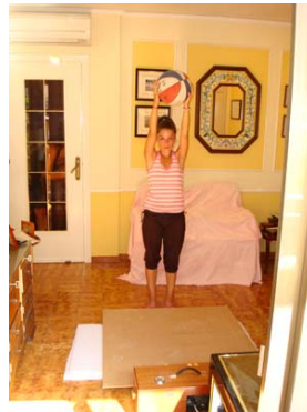
Figura 3: Lanzamiento de una pelota sobre una tabla de madera.

Se ha utilizado una pelota de baloncesto para medir el ruido de impacto generado por ésta. La pelota se deja caer desde una altura de 1,75 m desde el suelo.