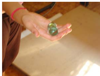
Figura 4: Canicas impactando sobre una tabla de madera.

Se utiliza un par de canicas para grabar el ruido de impacto generado por éstas. Se dejan caer las canicas desde una altura de 1,05 m del suelo.