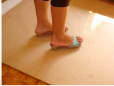
Figura 2: Impacto de zapatos de tacón de madera sobre una tabla.

Las fuerzas que soportan los suelos debido al paso de personas varían según los individuos considerados y, para una misma persona, dependen del calzado, del o los materiales que componen el suelo y del tipo de marcha (rápida o lenta; pesada o ligera).