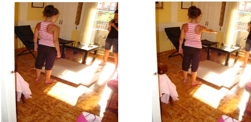
Figura 1: Lanzamiento de bolas sobre una tabla de madera

Las mediciones se realizaron en un edificio con, dos viviendas superpuestas, en la ciudad de Gandía. Para realizar las siguientes mediciones utilizamos unos zapatos de tacón de madera, una pelota de baloncesto y 3 canicas. El ruido de impacto producido por los diferentes objetos al caer al suelo se realiza siempre en el piso de arriba, recinto emisor. Grabamos el sonido que produce cada objeto al caer al suelo, primero en el piso de arriba y después medimos el sonido que genera cada objeto grabando desde el piso de abajo, recinto receptor. Medimos el ruido de impacto generado por unos zapatos de tacón poniendo una madera sobre el piso.