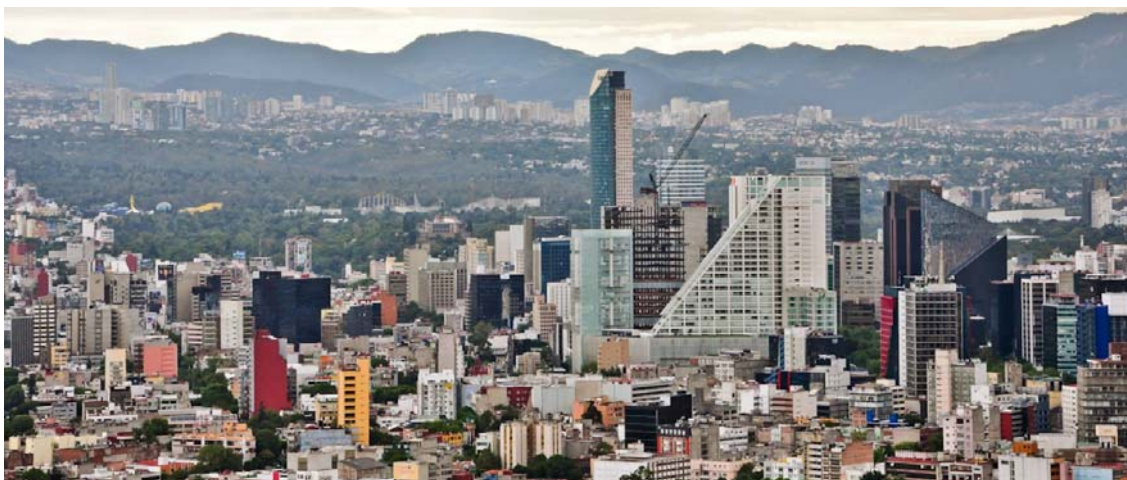
Figura 3. La Ciudad de México, y la periferia hacia el poniente. (Referencia: https://revistacitymanager.com/wp-content/uploads/2016/11/Mexico-City-3-1.jpg )

En su libro, aún vigente, Jacobs (1961) entre otras situaciones, reclamaba que los urbanistas modernos no entendieron lo que era una ciudad, solo se enfocaron en promover los conjuntos habitacionales, las torres y los suburbios, en su admiración por las ideas modernas de edificios altos, ciudades periféricas y redes de vialidad. Decía que lo único que provocaban, era el aislamiento y la salida de los habitantes de los centros urbanos hacia la periferia, dejando sin vida el centro de las ciudades. Para Jacobs, las nuevas ideas del urbanismo impedían los usos mixtos, que traían riqueza social a la ciudad ya que las consideraba cruciales para una vida pública vibrante.