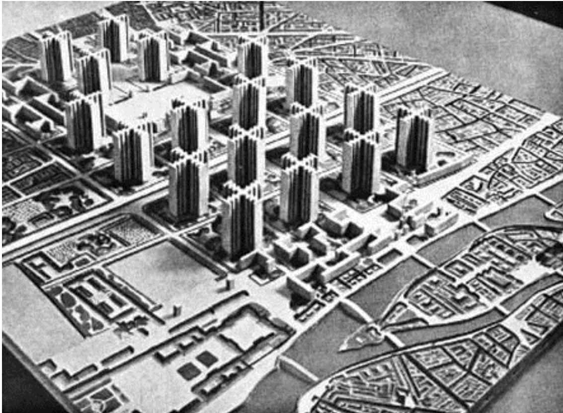
Figura 2. Plan Voisin para París, 1935, basado en la Ciudad Radiante (Ville Radieuse) . Le Corbusier..

Al final del siglo XIX, Ebenezer Howard, un clérigo y urbanista inglés, planteó el concepto de Ciudad Jardín donde a partir de una ciudad central, rodeaba a ésta con varias de ellas. Esto, con el objeto de ayudar a distender la acumulación de personas en dicho centro y combinar éstas con lo rural. Estas ciudades, estarían comunicadas con el centro pero a la vez independientes y autosuficientes.