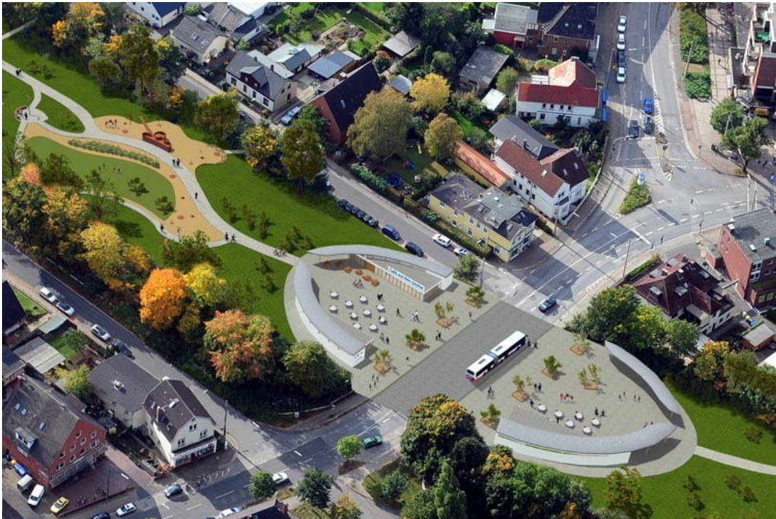
Figura 5. Hamburgo se prepara para una ciudad sin automóviles en un plan verde a futuro.

XI Congreso Iberoamericano de Acústica; X Congreso Ibérico de Acústica; 49º Congreso Español de Acústica -TECNIACUSTICA'18- 24 al 26 de octubre