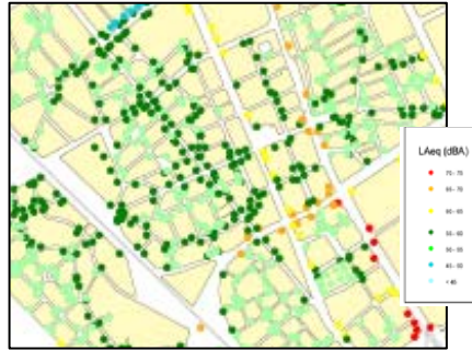
Figura 3. Distribución de la población expuesta al indicador L_{den} . Cada punto indica la dirección postal y población asignada en función del nivel sonoro del tramo de calle.