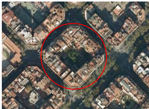
Figura 2. Ejemplo de manzana de viviendas con población afectada por diferentes niveles sonoros.

Así pues, del total de las manzanas que disponen de patio interior de manzana, el 30 % de población está expuesta al nivel sonoro correspondiente al interior de la manzana, mientras el 70 % de población restante está expuesta al nivel sonoro correspondiente a las calles.