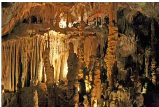
Figuras 1 e 2. Sala do Pastor e Cascata (Grutas da Moeda) e Grande Sala (Grutas de Santo António).